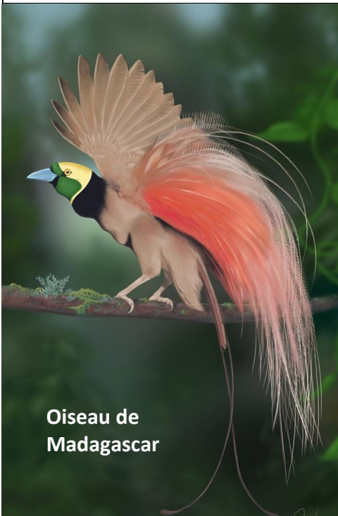
Oiseau de Madagascar

La gestion de Gaudin a remporté un maximum des records : Celui de la pollution, des embouteillages, de la pauvreté, des dégradations immobilières, de la vétusté des écoles, des fermetures de piscines, de destructions de parcs et jardins, de manque de terrains de sports, de coût du tramway au km, du manque de transports en communs, des trafics de drogues et de règlements de comptes, etc. et tout cela avec le plus beau des records: Le niveau d'endettement ! Faut le faire ! Et même l'opposition est en train de battre le record des divisions !