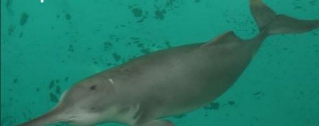
Dauphin de Chine

Mais ces menaces là sont reléguées à des images presque esthétiques de protection de l'environnement et la question démographique est toujours mise sur la faute des pauvres ou remise à plus tard !