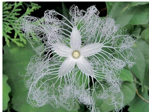
Voici l'étonnante fleur d'une aussi surprenante courge serpent !