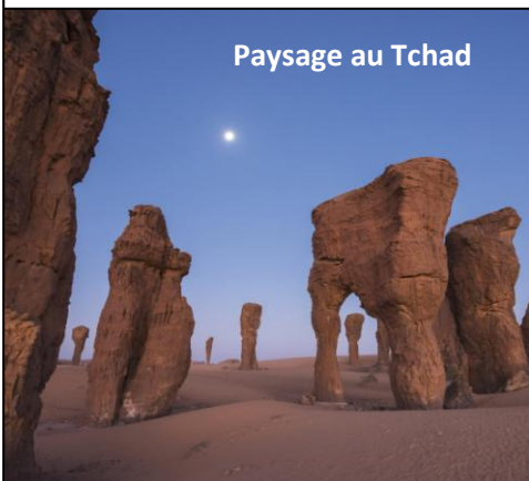
Paysage au Tchad

Le Trésorier-payeur général (TPG) d'Île-de-France a touché en 2015 255 579 € nets, soit 21 298 nets mensuels. En plus il faut savoir que 4 associations sont subventionnées grassement par l'état au bénéfice des fonctionnaires des finances dont 2 font déjà partie des 10 plus grosses subventions en France ! Ils peuvent même aller bosser de temps en temps au privé pour faire bénéficier des entreprises de leurs relations dans Bercy.